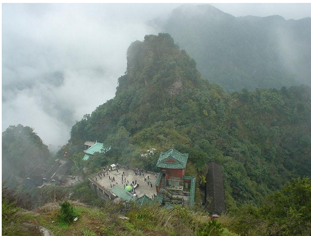
Obr. 1 Wu-tang-šan, provincie Chu-pej.