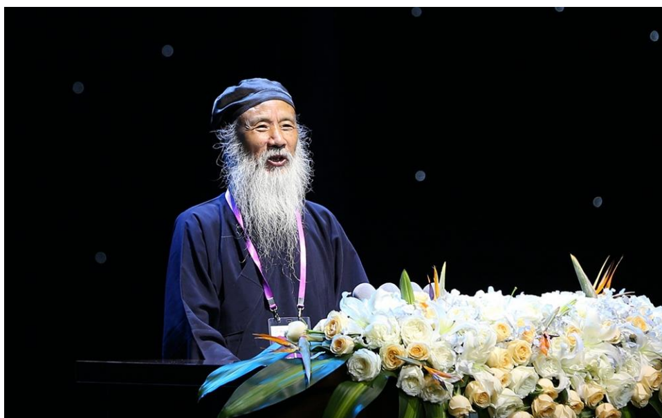
Obr. 5 Charismatický předseda Čínské taoistické asociace pan Žen Fažunga 任法融 zahajuje.