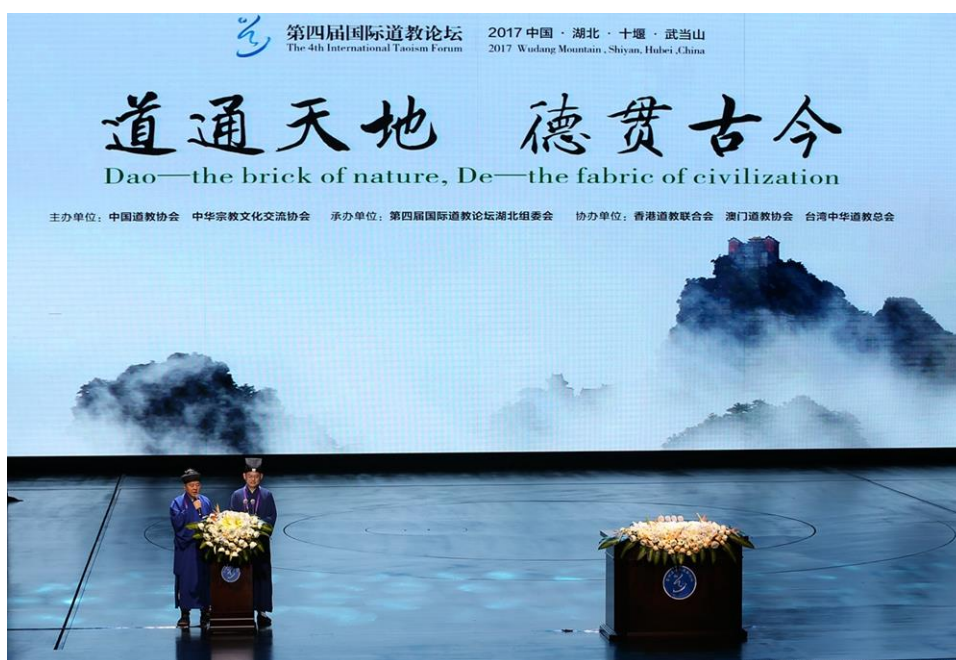
Obr. 4 Zahájení plenárního zasedání v konferenčním sále Divadla Tchaj-t'i 太極.

Vlastní jednání fóra bylo otevřeno 11.5.2017 plenárním zasedáním v konferenčním sále Divadla Tchaj-t'i 太極, zaměřeným na nosné téma celého fóra, které znělo: „TAO – základ přírody, TE – látka věcí starých i nových“ 道通天地，德贯古今 (Dào tōng tiān dì, Dé guàn gǔ jīn). Po něm následovala řada dalších paralelně probíhajících jednání k různým dílčím tématům taoismu, jako jsou například otázky morálky, etiky a integrity, kultivování životní cesty a zdraví mysli i těla, pěstování tolerance a mezikulturního dialogu, ale v neposlední řadě i otázky ekologické či sociální. Zde byl přednesen i příspěvek autora této zprávy o nezdolnosti jako životní premise (případová studie Lao-c': Tao te ťing, 50. kapitola).