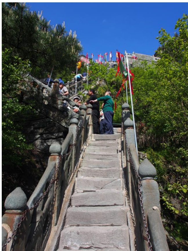
Obr. 2 Ke klášterním stavbám na vrcholu horského masivu Wu-tang vede mnoho schodů.