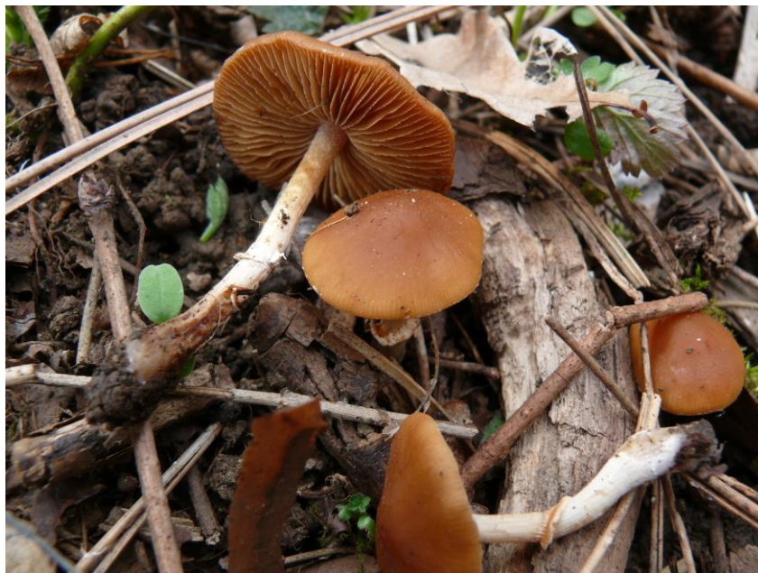
Obr. 3 Conocybe aporos Kits van Wav. – čepičatka (sametovka) bezpórá, typicky jarní druh, NPP Dalejský profil, úbočí Dalejského údolí nad Trunečkovým mlýnem, 305 m n. m., 24.IV.2013.