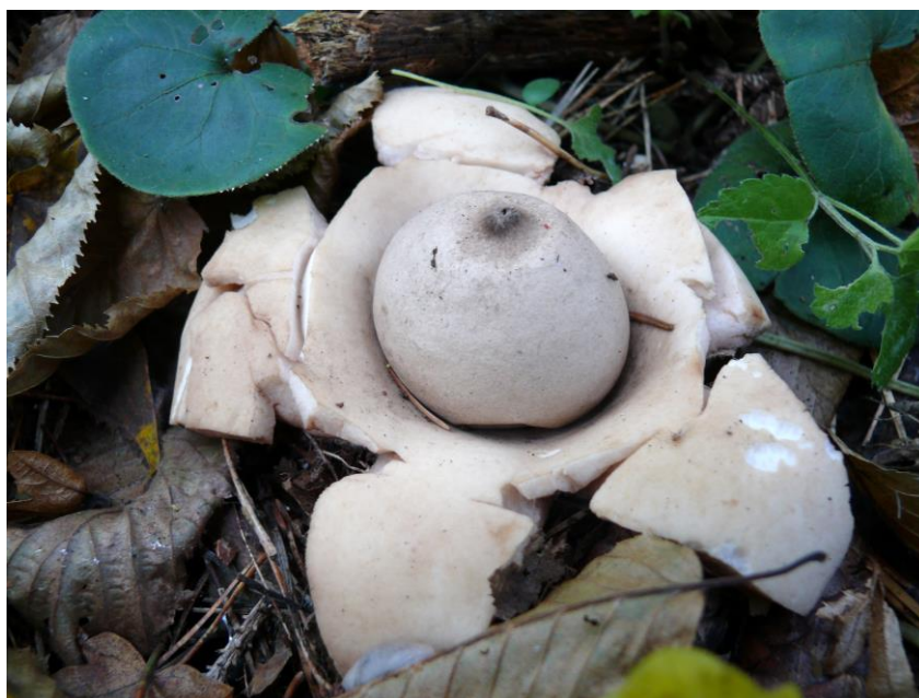
Obr. 4 Geastrum triplex Jungh. – hvězdovka trojitá, roztroušeně na zásaditých půdách v teplejších oblastech, NPP Dalejský profil, nad Trunečkovým mlýnem, 310 m n. m., 11.IX.2013.