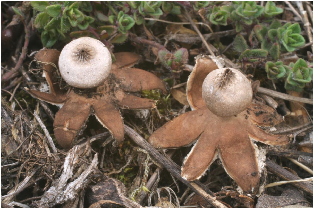
Obr. 1 Hvězdovka Pouzarova – Geastrum campestre var. pouzarii (V.J. Staněk) Calonge = Geastrum pouzarii V. J. Staněk, ohrožený druh podle Červeného seznamu hub ČR, NPP Dalejský profil, 13.IV.2012.

Centrum ekologického výzkumu a výchovy Vinařice 48, CZ-267 01 p. Králův Dvůr