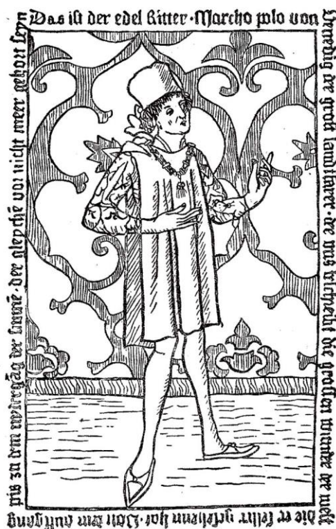
Obr. 7 Titulní stránka práce profesora Kolmaše "Marco Polo v Číně byl!" v Fragmenta Ioannea Collecta 10 (2009) – Frontispis prvního (německého) vydání "Knihy" Marca Pola (Nürnberg, 1477).